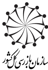
سازمان بازرسی کل کشور