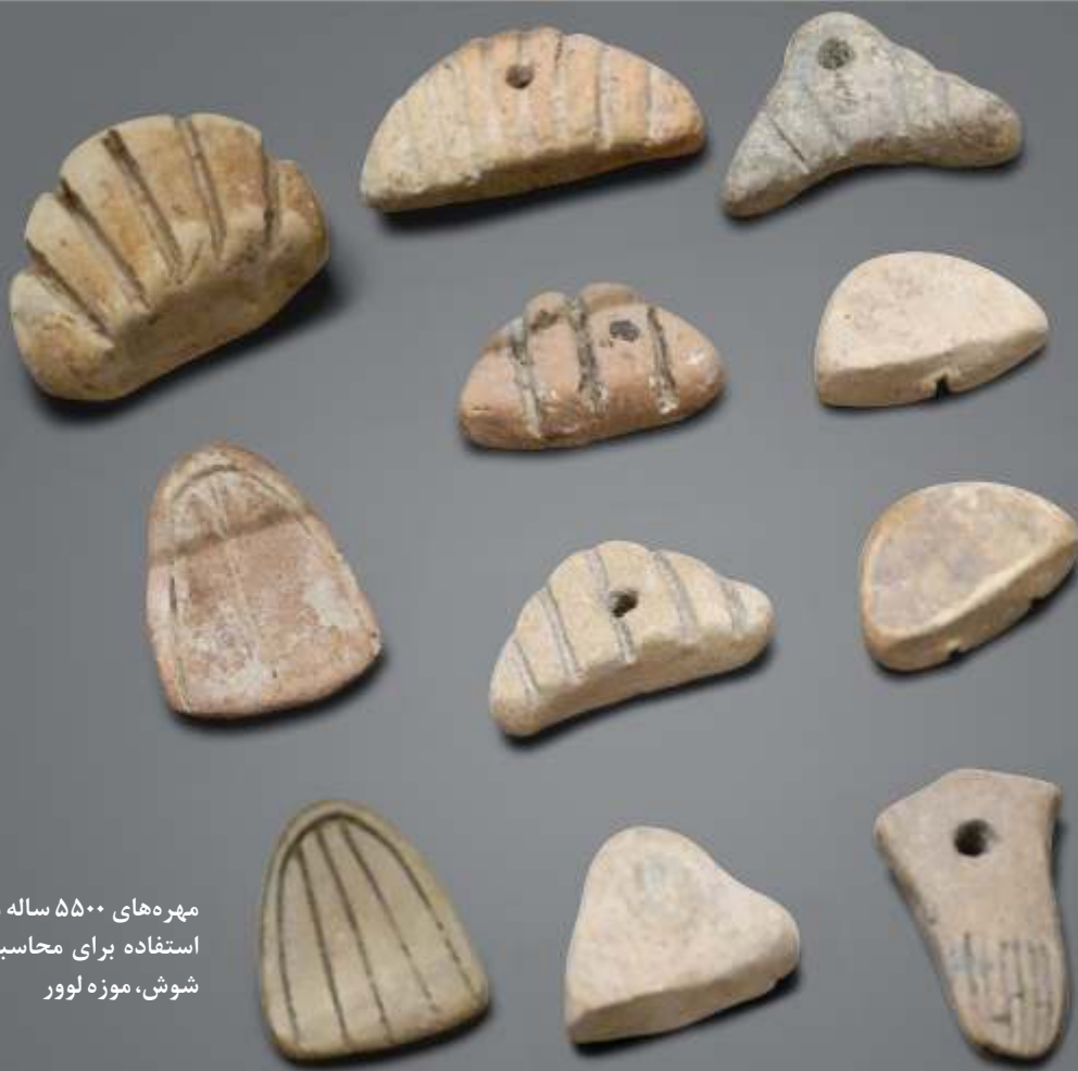
مهره‌های ۵۵۰۰ ساله مورد استفاده برای محاسبه در شوش، موزه لوور