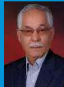
دکتر حسن همتی